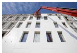
DuPont™ Corian®