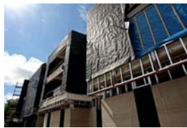
DuPont™ Tyvek® UV Facade