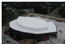
DuPont™ Corian®