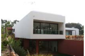
DuPont™ Corian®

Per informazioni su DuPont™ Zodiaq®: www.zodiaq.it