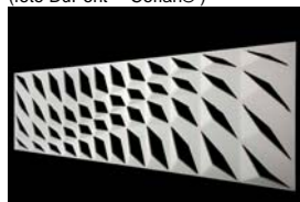
DuPont™ Corian® 3D/Math, il modello Gauss