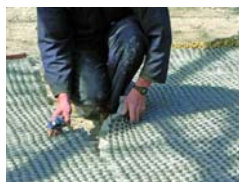
DuPont™ GroundGrid®