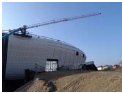
DuPont™ Tyvek® (foto DuPont™ Tyvek®)

DuPont™ Tyvek® membrana monostrato traspirante che offre agli edifici una combinazione unica di protezione dall’acqua e dal vento, lunga durata, traspirabilità, contribuendo ad aumentare il comfort degli ambienti interni e l’efficienza energetica; Per informazioni su DuPont™ Tyvek®: www.construction.tyvek.it .