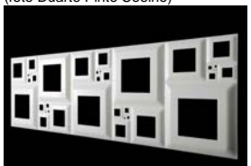
DuPont™ Corian® 3D/Math, il modello Fibonacci