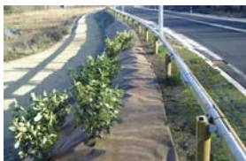
DuPont™ Plantex®

Per informazioni: www.plantexpro.dupont.com