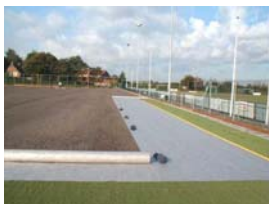
DuPont™ Typar® (foto DuPont™ Typar®).

Per informazioni su DuPont™ Typar®: www.typargeo.com